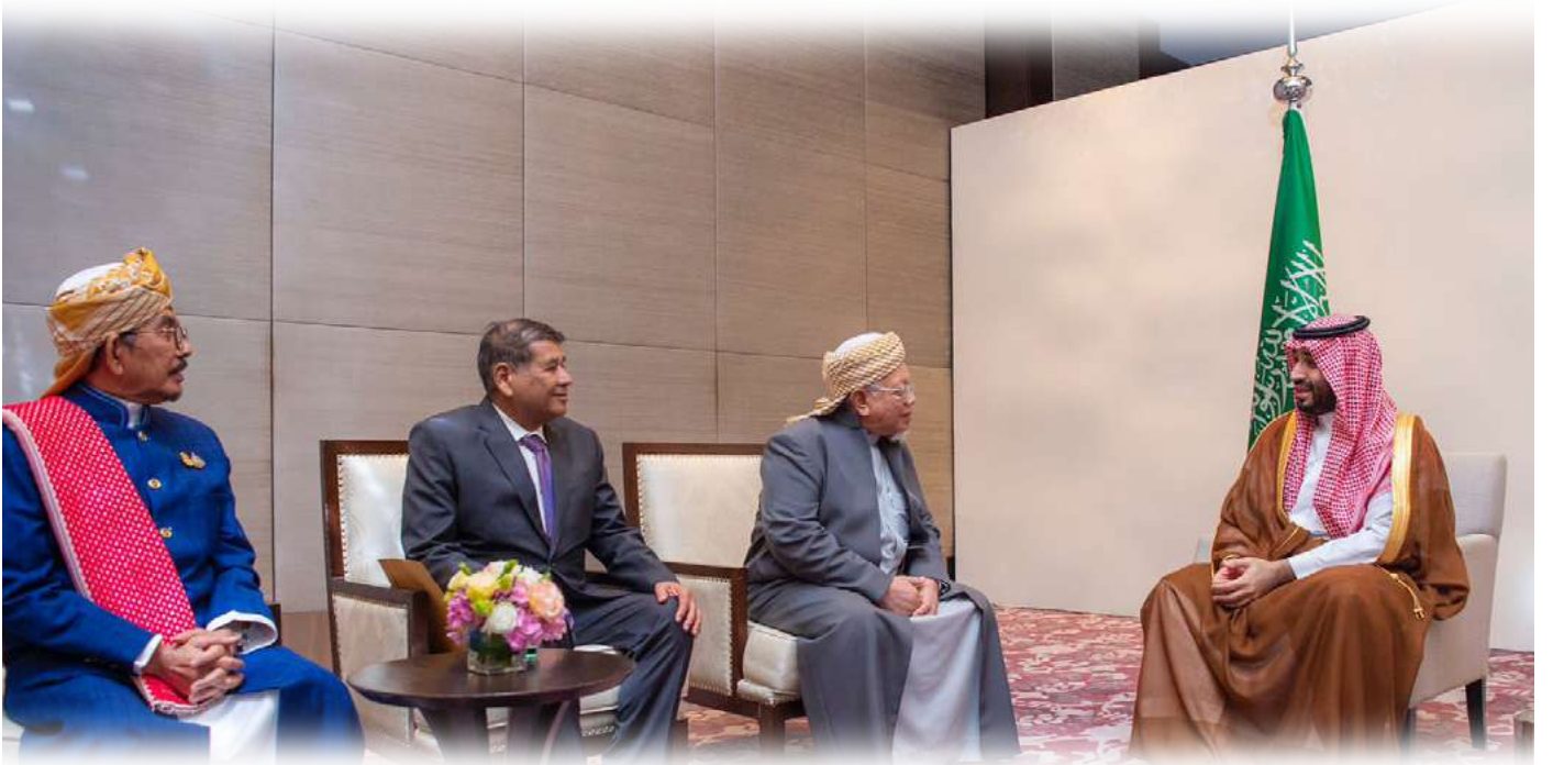
سمو ولي العهد السعودي الأمير محمد بن سلمان يستقبل في مقر إقامته بالعاصمة التايلندية بانكوك أعضاء المجلس المركزي الإسلامي في تايلند.