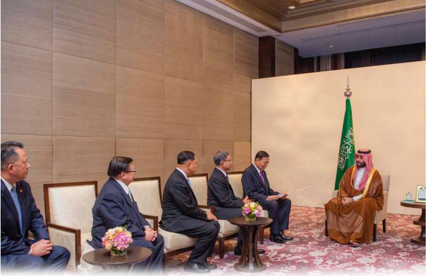
سمو ولي العهد السعودي الأمير محمد بن سلمان يستقبل في مقر إقامته بالعاصمة التايلندية بانكوك رئيس مجلس الشيوخ التايلندي.